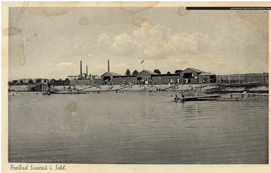
Freibad Saaraui i. Schl.

Latem 1926 r., z inicjatywy władz i rady gminy, na terenie pokopalnianego stawu, pomiędzy obecnymi ulicami Słowińska (powstała dopiero w II połowie lat trzydziestych) i Stanisława Wyspiańskiego powstało kąpielisko, nazywane w miejscowym języku ludowym „Baggerloch” (wyrobisko, sztuczny staw). Latem mieliśmy nasz uboższy Baggerloch, można przeczyć że wspomnianych byłych mieszkańców niemieckiego Żarowa. Teren kąpieliska był ogrodzony (po wojnie drewniany płot wykorzystano do ogrodzenia stadionu sportowego), obowiązywały bilety wstępu i stroje kąpielowe, zakazane było spożywanie alkoholu i palenie papierosów. Były przebieralnie i wypożyczalna łódki. Nad porządkiem czuwali pracownicy zatrudnieni przez Gminę. Kąpielisko było czynne w okresie letnim codziennie od godziny osiem rano do dwudziestej pierwszej z godziną przerwą od dwunastej do trzynastej.