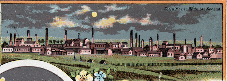
Jda u. Marien Hütte bei Saarau.