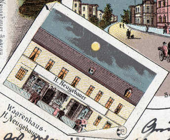
Warenhaus H. Neugebauer